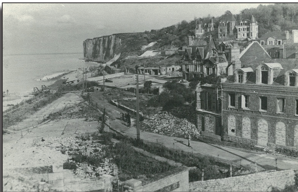
L'environnement de la plage en 1940