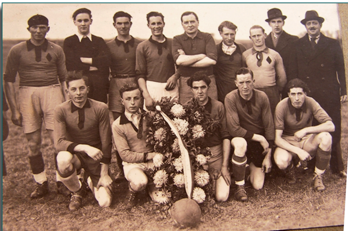
L'équipe de football de Veules-les-Roses - 26 novembre 1944 lors d'une rencontre avec une équipe anglaise