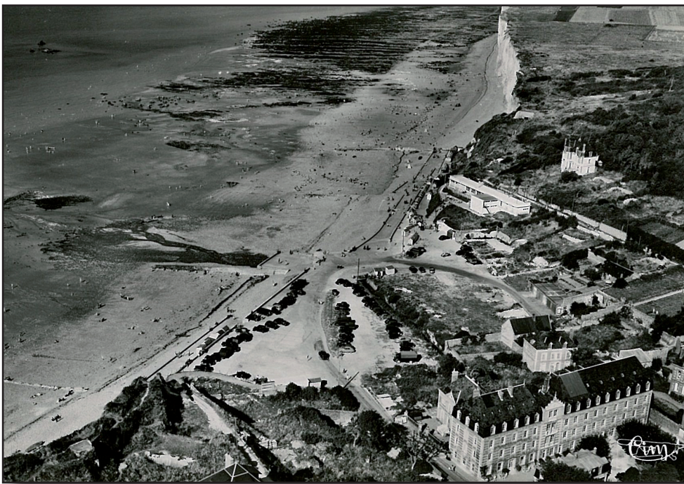
La plage et le front de mer devasté après la guerre de 1940