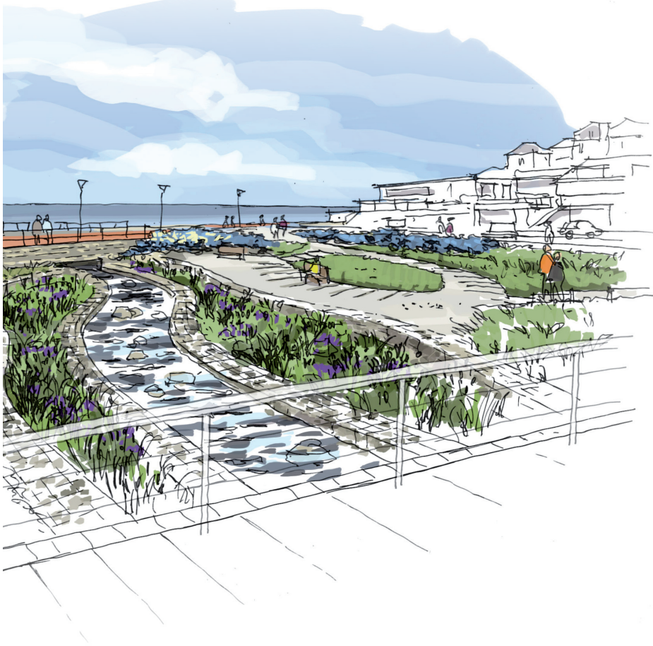
Perspective du projet du Front de Mer